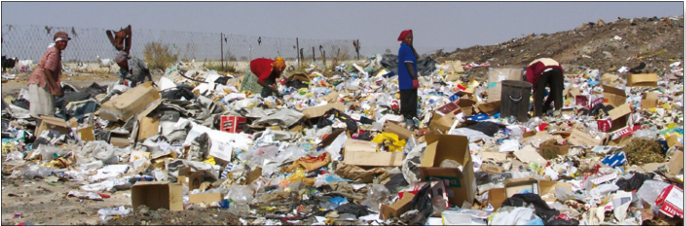
Sopsortering i Namibia.

För att uppnå hållbar utveckling måste flera dimensioner av samhällets funktioner beaktas. Några frågor man kan ställa sig utifrån hållbarhetsbegreppets tre dimensioner är: