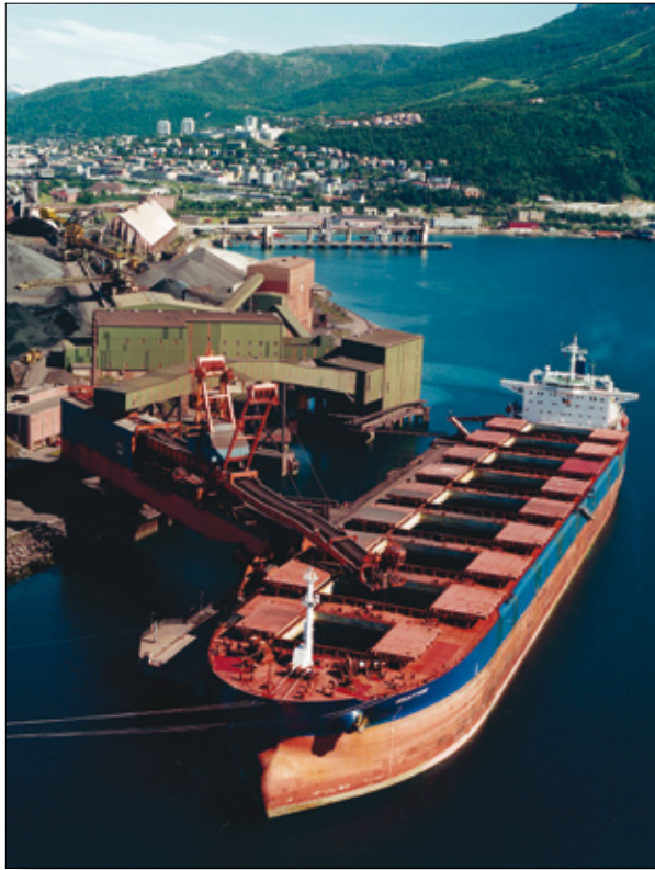
Lastning av sinterkolor i Narviks hamn, Norge. För att få ner vikten på järnmalm brukar den förädlas till sinter. Sinter tillverkningen sker nära gruvorna. Sinterkulorna kommer från LKAB i Kiruna. Narviks hamn är isfri året om.

burit att järn- och stålframställningen mer och mer har omlokiserats till järnmalmsfyndigheterna. Idag har den ökade efterfrågan på stål gjort att gamla järnmalmsgruvor har blivit attraktiva för brytning igen.